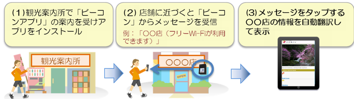
【本トライアルの利用イメージ】

スマートフォンやタブレット端末がインターネットに接続された状態で、通知されたメッセージをタップしビーコンアプリを起動させると、その店舗の情報をスマートフォンやタブレット端末の言語設定に従い自動翻訳し表示します※3。店舗は、来訪者向けの情報を日本語で用意するだけで、訪日外国人のお客さま向けに多言語対応した情報の提供ができるようになります。